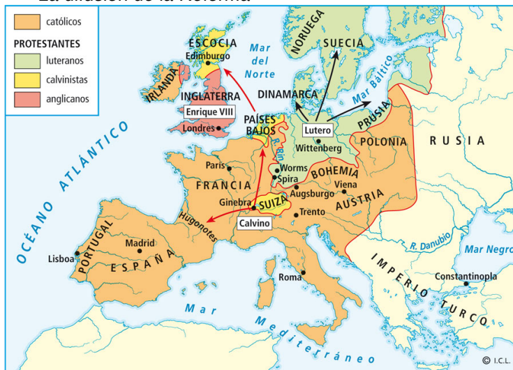
La difusión de la Reforma

9. Observa este mapa e indica los territorios por los que se extendieron el luteranismo, el anglicanismo y el calvinismo.