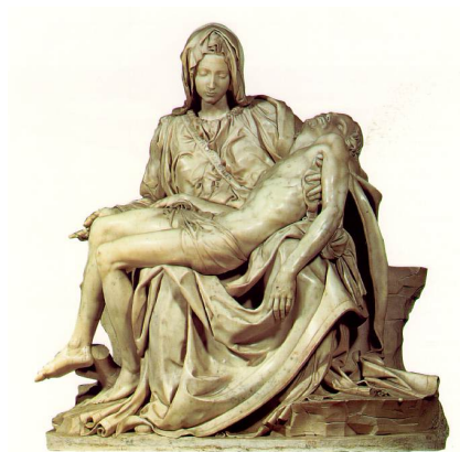
La Piedad, Miguel Ángel