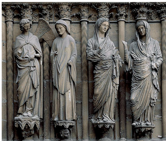
Pórtico de la catedral de Reims, siglo XIII.