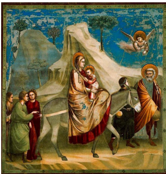
Giotto: La huida a Egipto, 1305.

En cuanto a la pintura , la estructura de las catedrales, que sustituía parte de los muros por grandes ventanales, redujo el espacio que el Románico concedía a la pintura. Ello provocó el abandono de la pintura mural al fresco y la generalización de la pintura sobre tabla de madera ( retablos ) y la pintura de vidrieras . Los temas eran básicamente religiosos , con especial preferencia por las vidas de Cristo, la Virgen y los santos. Su estilo mostraba un mayor interés por el realismo y los fondos dorados se fueron sustituyendo por arquitecturas y paisajes. Además, las figuras tenían unas proporciones más naturales y se buscaba la expresividad a través de los gestos y los rostros.